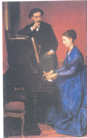
Domingo VALDIVIESO: Luna de miel, obra maestra del Romanticismo murciano.